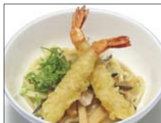
183. Tempuraudon 9,50 Suppe mit Shrimps & Gemüse Tempura