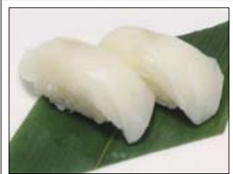
416. Hirame 6,00 Heilbutt