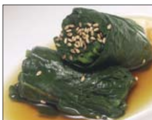
125. Horenso Gomaae 3,50 gekochter Spinat mit jap. Dressing