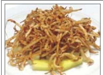
106. Sojasprossen 5,50