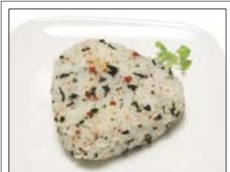
432. Onigiri 2,50 Reis mit getrocknetem Kaviar