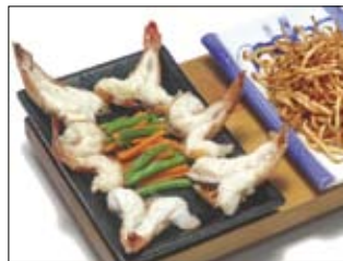
503. Ebi 4 20,00 Shrimps gebraten