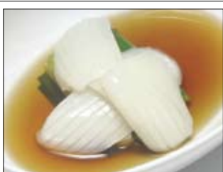
132. Hot Tatoika 4,00 gekochter Tintenfisch auf gek. Spinat & Frühlingzwiebeln in jap. Dressing