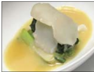
138. Hotate Nuta 6,00 Jakobsmuschel auf gekochtem Spinat & Frühlingszwiebeln in Misoauce