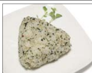
431. Onigiri 2,50 Reis, vegetarisch