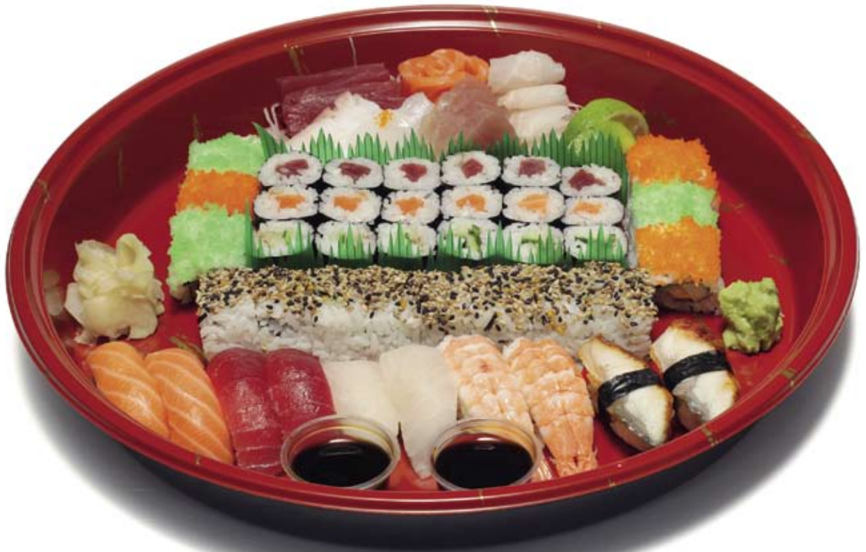
581. PartyBox Sashimi, Maki, Nigiri – für 3-4 Personen – 60,00