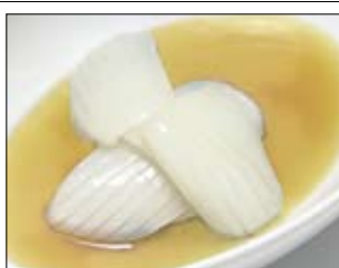
133. Ikanuta 4,00 Tintenfisch auf gekochtem Spinat & Frühlingzwiebeln in Misoauce