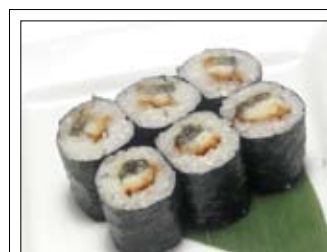
373. Unagi Maki 6,00 mit gegrilltem Aal