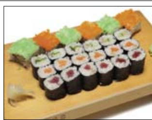
351. gem. Maki-Platte 1 19,50 Gemischte Maki-Platte

Rollen aus Reis mit verschiedenen Einlagen und Seetang