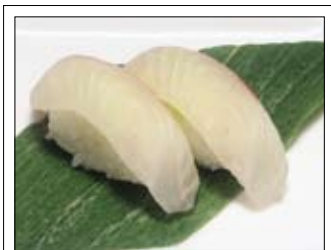
405. Tai 4,50 Dorade