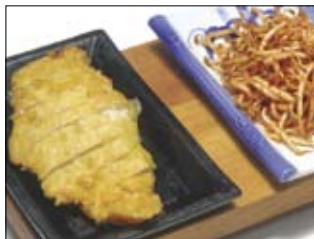
502. Tori 4 14,00 frittierte Hühnerbrust mit Erdnuß-Knoblauch-, süßsauer oder Sojasauce