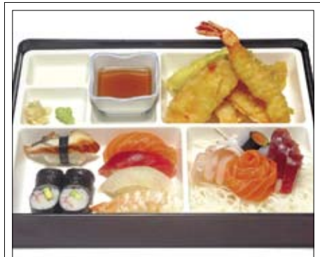
342. BENTO Variation 20,00 Gemischte Variationen: Sushi, Sashimi, Maki & Ebitempura