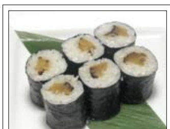
370. Shiitake Maki 4,50 mit Shitake-Pilz

Rollen aus Reis mit verschiedenen Einlagen und Seetang