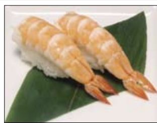
415. Ebi 5,00 Shrimps