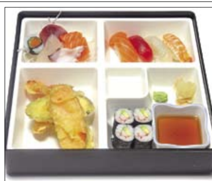
341. BENTO 16,00 Gemischte Box mit Sushi, Sashimi, Yasai Tempura & Maki