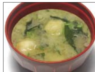
184. Miso - Shiru 2,50 japanische Misosuppe