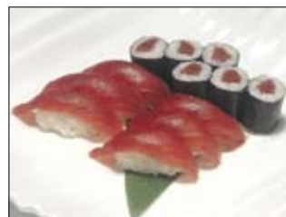
326. Sushi 17,50 Thunfisch-Sushi