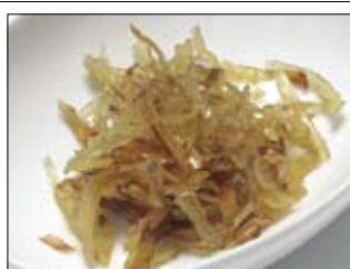
131. Kawahagi 4,00 japanischer Doerrfisch