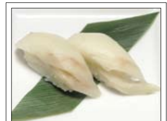
408. Ibodai 4,50 Butterfisch