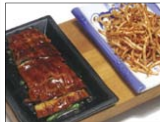
504. Unagi 20,00 gegrillter Aal