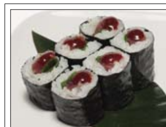
381. Tekkamaki Tsuetsu Na 5,50 mit frischem Thunfisch, Lauch & scharfer Sauce