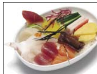
327. Chirashi 16,00 Rohfisch auf Reis, locker belegt