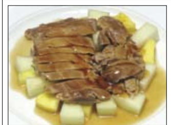
102. Entenbrust 8,50 mit japanischer spezial Sojasauce