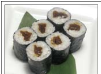
369. Kanpyo Maki 3,50 mit japanischem Kürbis