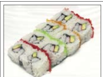
366. California Maki 1 9,00 Inside out mit Tobikko außen