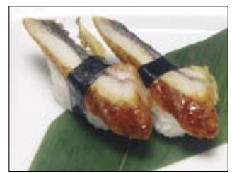
420. Unagi 6,50 gegrillter Aal