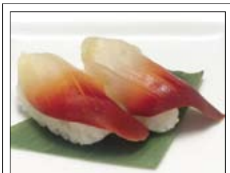
409. Hokkigai 5,00 Trogmuschel