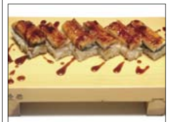
328. Unagi No Bo-Sushi 15,00 Sushi mit gegrilltem Aal