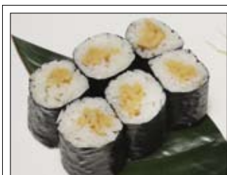
379. Natto Maki 1 4,50 mit gegorene Sojabohnen