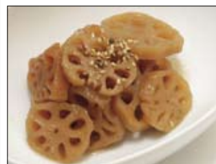
148. Renkon 4,00 Lotuswurzeln