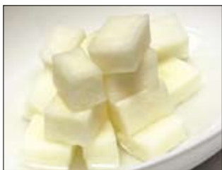
128. Oshinko 3,50 eingelegter Rettich