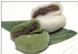
601. Japanischer Reiskuchen 3,00