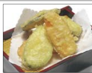
162. Yasai - Tempura 3,50 Gemüse