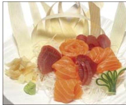
312. Sashimi 18,00 Lachs und Thunfisch