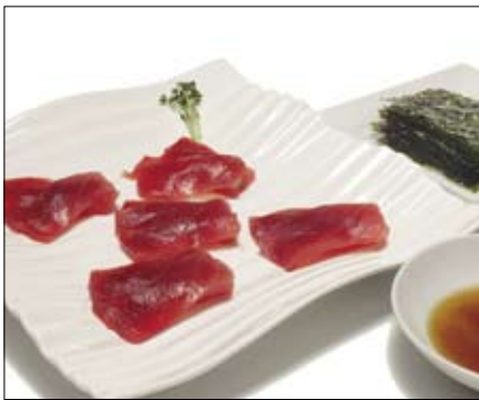
311. Sashimi 18,00 Thunfisch mit Sesamöl und Nori

...geschnittener Rohfisch, kunstvoll dargereicht