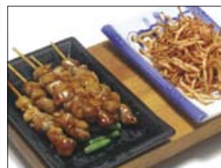
508. Yakitori Menue 4 14,00 gegrillte Hühnerspieße mit Gemüse