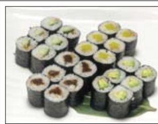
352. veg. Maki - Platte 15,00 Vegetarische Maki-Platte