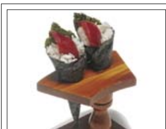
376. Temaki 5,00 zwei Tütchen mit Thunfisch