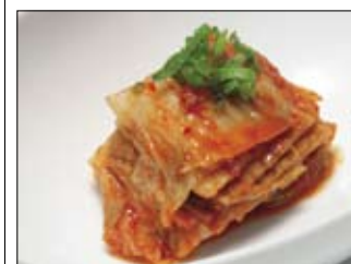
122. Kimschi 4 3,50 scharf eingelegter Chinakohl