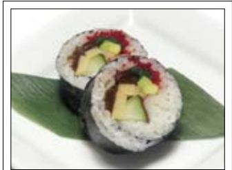
361. Futomaki 1 10,00 Dicke Seetangrolle, acht Stück