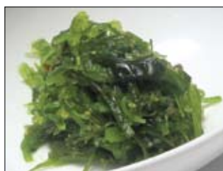
123. Kaiso Sarada 3,50 Seetangsalat