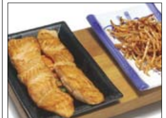
505. Sake Teri Yaki 4 14,00 gegrillter Lachs mit Teri-Yaki-Sauce