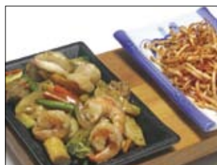
507. Sakana Itame 4 16,00 gebrat. Shrimps, Thunfisch, Oktopus