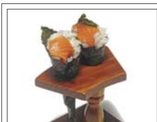
375. Temaki 5,00 zwei Tütchen mit Lachs