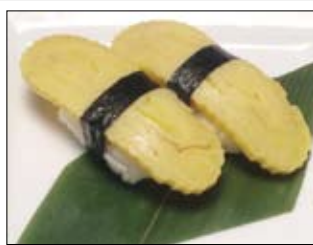
414. Tamago 4,00 Eieromelett