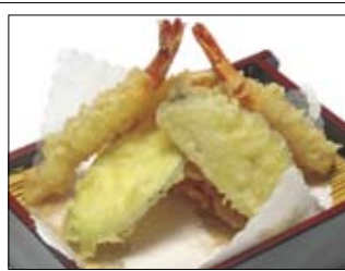
161. Ebi - Tempura 6,50 Shrimps