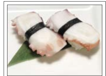
404. Tako 4,00 Oktopus