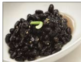
144. Kuru Kotou 4,00 Schwarze Bohnen