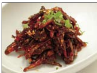
146. Malchi 6,50 Anchovis, getrocknet & mariniert, scharf