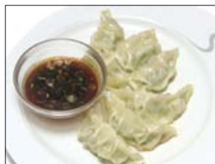
143. Gyoza 4,50 gegrillte Teigtaschen mit Fleischfüllung u. pikanter Sauce