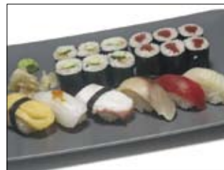
322. Sushi 15,00 gemischte Platte, wahlweise mit Inari oder Tamago (419/414)