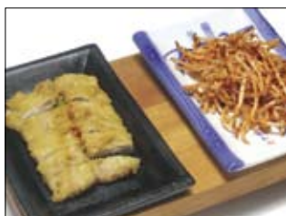
506. Maguro 4 15,00 fritierter Thunfisch mit pikanter Sauce