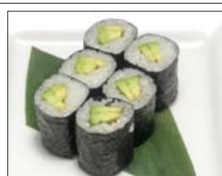
364. California Roll 4,50 mit Avocado