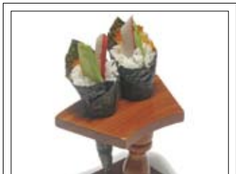
365. California Handroll 1 5,50 zwei Tütchen mit Avocado, Surimi & Fischeiern