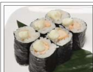
380. Sake Mayo 5,50 gegrillter Lachs mit Majonaise