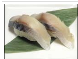
406. Saba 4,00 Makrele