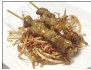
135. Yakitori 5,50 gegrillte Hühnerspieße