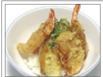
163. Ten Don 9,50 Tempura auf Reis