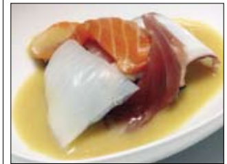
141. Mixnuta 5,00 Div. Fisch auf gekochtem Spinat & Frühlingszwiebeln in Misoauce