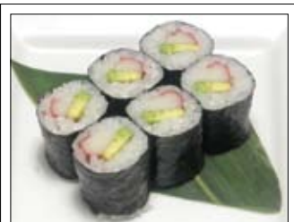
362. California Roll 5,00 mit Avocado und Surimi