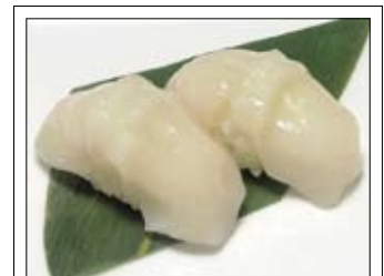
412. Hotate 5,50 Jakobsmuschel