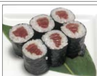
367. Tekkamaki 5,00 mit rohem Thunfisch