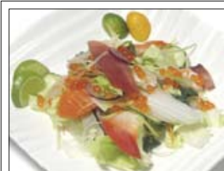
104. Sashimi Salat 8,50 mit japanischem Dressing