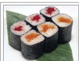
372. Tobikko Maki 1 5,00 mit Fischeiern vom fliegenden Fisch