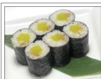
371. Oshinko Maki 4,50 mit japanischem Rettichpickels