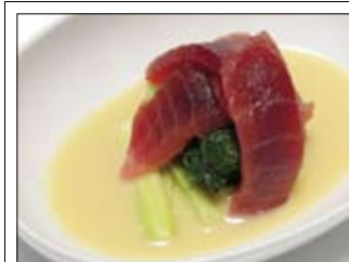
134. Maguronuta 5,00 Thunfisch auf gekochtem Spinat & Frühlingzwiebeln in Misoauce