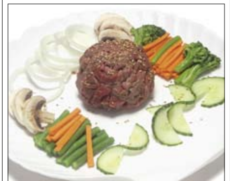
562. Gyuniku Menue 20,00

Dieses Gericht wird am Tisch zubereitet, vorab erwartet Sie eine kleine Vorspeise. Rinderfilet am Tisch gegrillt Horenso Gomaee - gekochter Spinat Porree Salat - feingeschnitt. Porree in scharfer Sauce