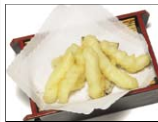
166. Ika-Tempura 4,50 Tintenfisch