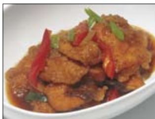
142. Nanbanzuke 4,00 frisch fritierter Lachs in scharfer Brühe