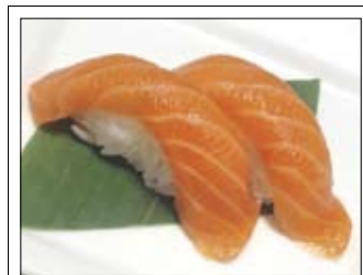
407. Sake 4,50 Lachs