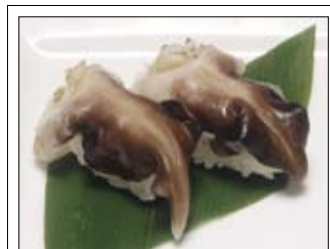
410. Torigai 8,50 Herzmuschel