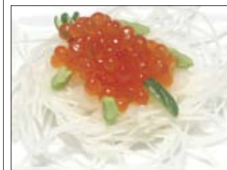
130. Ikuraoroshi 4,50 Lachskaviar mit geriebenem Rettich