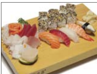
325. Sushi-Variation 21,00 Gemischte Platte mit Sushi, Sashimi und Maki