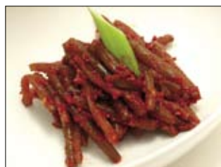
147. Manul Gugli 4,50 Knoblauchstangen, scharf