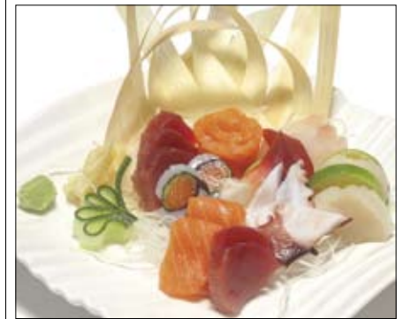
313. Jo - Sashimi 20,00 versch. Rohfische, hochwertige Auswahl