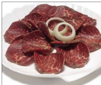
561. Yakiniku Menue 25,00

Gemischtes Gemüse mit frittiertem Fisch & Shrimps , dazu jap. Dressing, Horenso Gomaee - gekochter Spinat