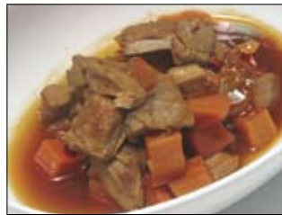
139. Maguro No Kakuni 4,50 dampfgegartener frischer Thunfisch mit Gemüse