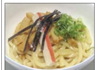
181. Udon 7,00 klare Suppe mit Udon