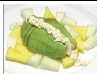
105. Köstliche Avocado 7,00 mit spezial Mayonnaise