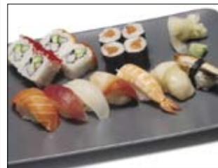
323. Jo-Sushi 18,00 gemischte Platte, hochwertige Auswahl