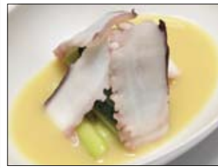
136. Takonuta 4,50 Oktopus auf gekochtem Spinat & Frühlingszwiebeln in Misoauce