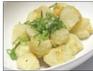
140. Agedashi Tofu 4,50 frischer Tofu frittiert mit Spezialsauce