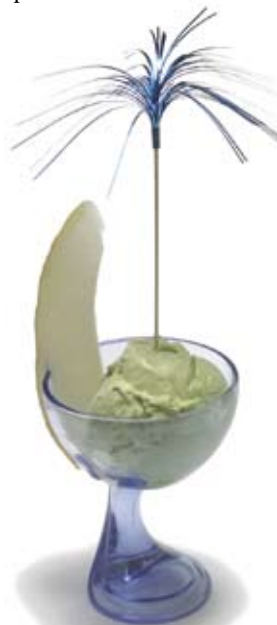
602. Grüner Tee Eis 3,00