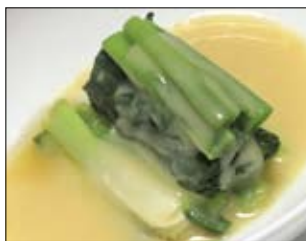
129. Neginuta 3,00 Porree mit Misoauce