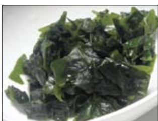
124. Kaiso Sarada 3,50 Seetangsalat mit japanischem Dressing