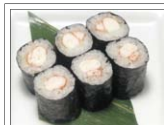
377. Ebimaki 5,50 mit gekochten Shrimps