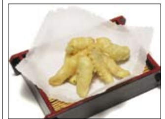
167. Tori-Tempura 4,50 Hühnchen