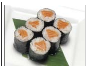
374. Sakemaki 5,00 mit Lachs