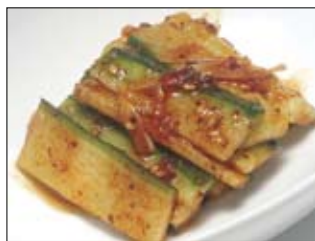
127. Oi Kimschi 3,50 scharf eingelegte Gurke