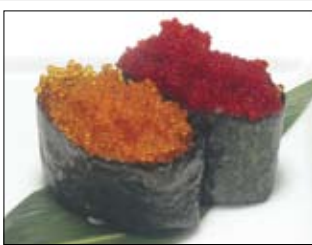
413. Tobikko 5,00 Fischeier vom fliegenden Fisch

2 Häppchen aus Reis mit diversen Auflagen