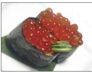
417. Ikura 5,50 Lachskaviar