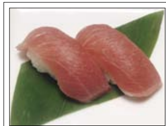
402. Toro 6,00 Thunfisch