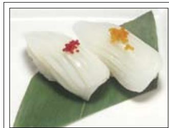
403. Ika 4,00 Tintenfisch