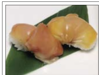
411. Akagai 6,50 Archenmuschel