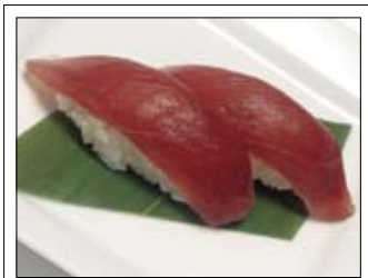
401. Maguro 5,00 Thunfisch

2 Häppchen aus Reis mit diversen Auflagen