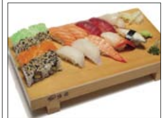
324. Sushi-Set 21,00 Hochwertige Sushi und Maki