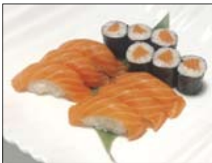
321. Sushi 14,50 Lachs-Sushi

...diesen einzigartigen Genuß servieren wir Ihnen original in hervorragender Qualität