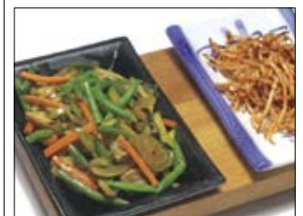
509. Yasai Itame 4 11,00 gebratenes Gemüse