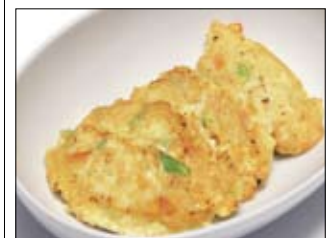
149. Tofu Yaki 3,50 Gemüse mit Tofu, gebraten