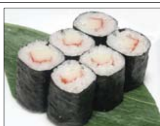
363. Surimi Maki 4,50 mit Surimi