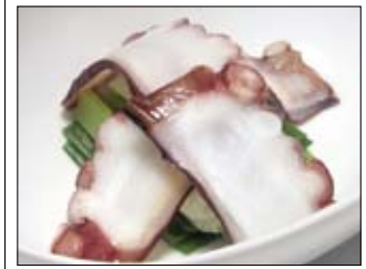
137. Takosu 4,50 Oktopus auf gekochtem Spinat & Frühlingszwiebeln mit jap. Dressing