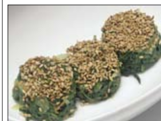
126. Horenso Gomaae 3,50 Spinat mariniert mit Sesam