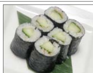
368. Kappa Maki 3,50 mit Gurke