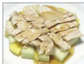
101. Hühnchenbrust 7,50 mit japanischer spezial Sojasauce