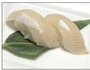
418. Hamachi 6,50 Yellowtail