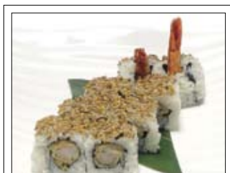
378. Ebi Temroll 7,50 mit frittierten Shrimps