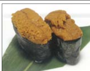
422. Uni 8,00 Seeigel