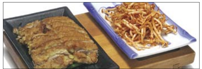
501. Kamo 4 15,00 knusprig frittierte Ente mit Erdnuß-, Knoblauch-, süßsauer oder Sojasauce

Beachten Sie bitte auch unsere sorgfältig ausgewählten Menues auf der folgenden Seite