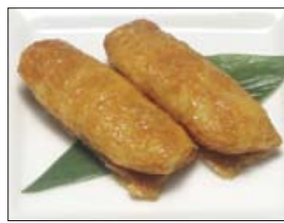
419. Inari 4,00 fritierter Tofu