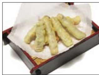
165. Maguro-Tempura 4,50 Thunfisch