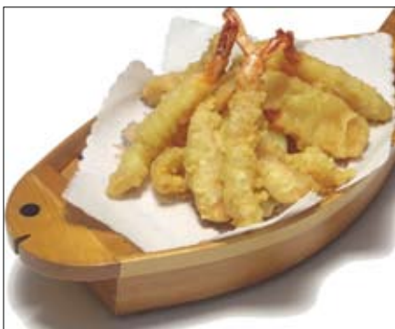
551. Tempura Menue 18,00

Gemischtes Gemüse mit frittiertem Fisch & Shrimps , dazu jap. Dressing, Horenso Gomaee - gekochter Spinat