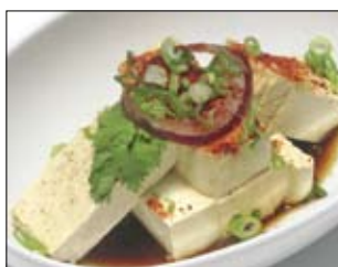
121. Hiyayakko 3,00 frisch gekochter Tofu mit Marinade