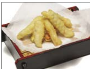
164. Sake-Tempura 4,50 Lachs