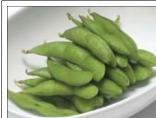
103. Edamame 3,50 gekochte grüne Bohnen