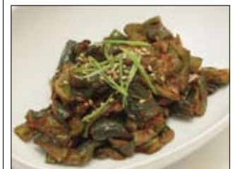
145. Shisozuke 3,50 Scharf marinierte Gurken