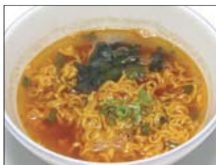
182. Ra Myen 4 6,00 Fadennudelsuppe, scharf