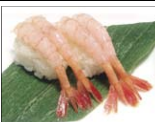
421. Amaebi 4,00 Süßwasser Shrimps